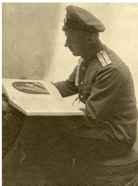
В минуты отдыха. Latvijas Kara muzejs — Латвийский военный музей, Рига ★