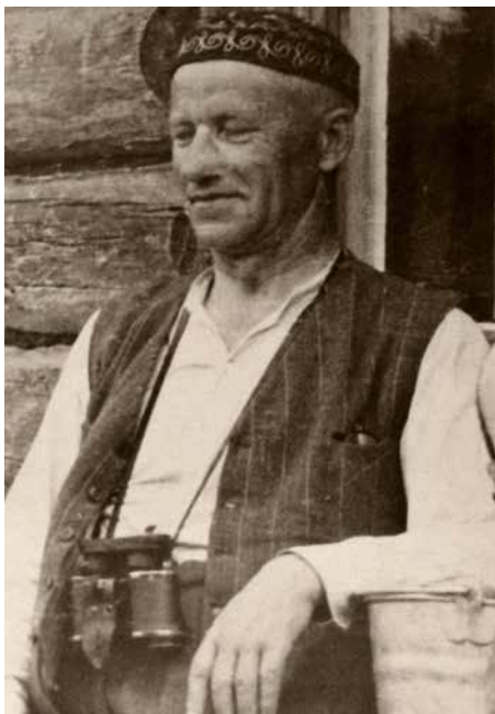
В Пиебалге в последние годы жизни.