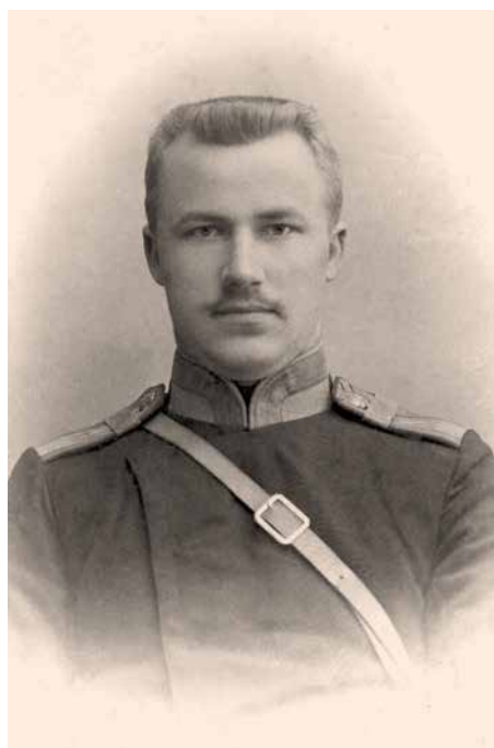
В. Озолс в Виленском пехотном юнкерском училище. 1905 г. Latvijas Kara muzejs — Латвийский военный музей, Рига ★

В канун первой русской революции революционная волна захлестнула его и потащила за собой. Позднее в автобиографии Озолс написал: «Во мне и моих единомышленниках родилось убеждение, что для победы революции необходимо овладеть военным искусством» 8 . Сложно сказать, считал ли он так в юности или уже в зрелом возрасте выдавал желаемое за действительное. В училище Озолс, по его позднейшему заявлению, создал революционную подпольную организацию, имевшую контакты с революционерами в Риге и Санкт-Петербурге 9 . По другим данным, Вольдемар вступил в подпольный революционный кружок, связанный с виленским комитетом РСДРП и Социал-демократической партией Литвы. В работе кружка участвовали в основном юнкера прибалтийского и польского происхождения. В отпуску Озолс ездил в Ригу, где читал подпольщикам лекции по тактике уличного боя и применению артиллерии 10 . С весны 1907 г. члены кружка даже выпускали нелегальный рукописный журнал под редакцией юнкера Я. Рейнголдса. В 1907 г. при уборке помещений училища нашелся тюк с нелегальной литературой на латышском и русском языках. Рейнголдс и еще один юнкер взяли всю вину на себя. Был аре-